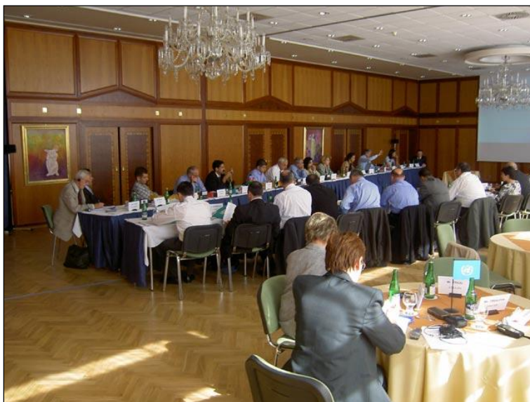
„ Financial Viability and Capacity Development to Manage Public Services at Local Level “, 14.-18.9.2004, hotel Olympik Praha